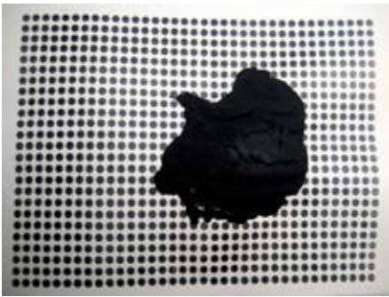
Artikel von Hartmut Glänzel, S. 36